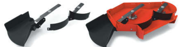
Set za bočno izbacivanje