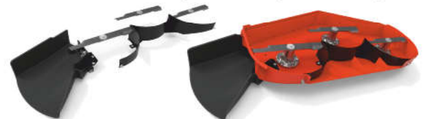
Set za bočno izbacivanje