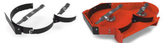
Set za stražnje izbacivanje i malčiranje