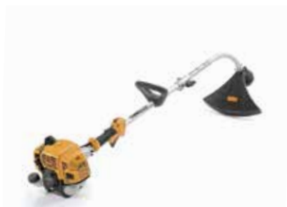
GT 330 A