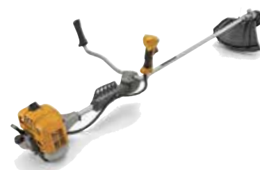
BC 535 B