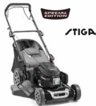
CP1 484 WQ