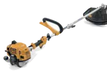
BC 330 A

Snaga / Zapremina Zapremina spremnika Glava flaksa Tip noža Tip rukohvata Tip osovine Naramenice Sustav protiv vibracija Neto težina Cijena