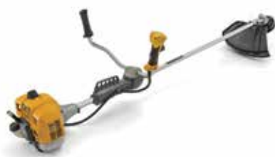
BC 545 B