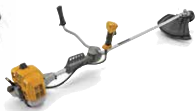
BC 555 B

Snaga / Zapremina Zapremina spremnika Glava flaksa Tip noža Tip rukohvata Tip osovine Naramenice Sustav protiv vibracija Neto težina Cijena