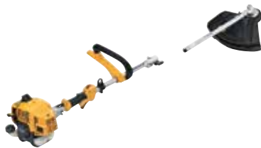
MT 330 - 5 u 1