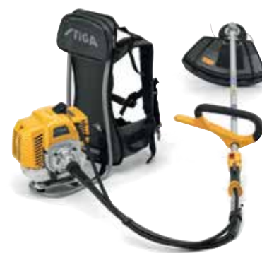
BC 555 R