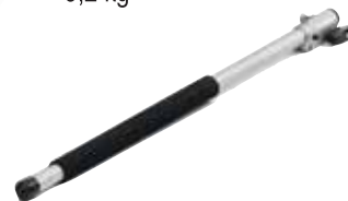
Produžna osovina 70 cm